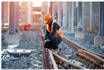
Προϋπολογισμός 494,8 εκ. €, Ενίσχυση Ε.Ε. WBIF 80 εκ. €

14. Ενίσχυσης βιώσιμης ασφάλειας μεταφορών (Safe and Sustainable Transport Program – SSTP), μέσω βελτίωσης οδικής ασφάλειας, δημιουργίας υποδομών ανεφοδιασμού με εναλλακτικά καύσιμα και ανάπτυξης έξυπνων συστημάτων μεταφορών, σε πλαίσιο πράσινης ατζέντας (Χώρες WB6)