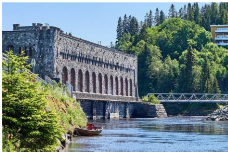
Προϋπολογισμός 18,9 εκ. €, Ενίσχυση Ε.Ε. WBIF 3,1 εκ. €, αναμενόμενη ολοκλήρωση 2026

5. Εκσυγχρονισμός της Υδροηλεκτρικής Μονάδας Čarlijina (Βοσνία και Ερζεγοβίνη), προκειμένου να επεκταθεί η διάρκεια παραγωγικής ζωής της κατά 15 έτη