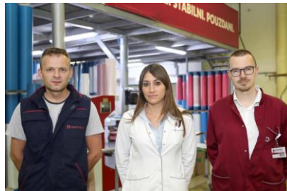
Προϋπολογισμός 40,4 εκ. €, Ενίσχυση Ε.Ε. WBIF 10,4 εκ. €

12. Πρόγραμμα SAFE - Ενίσχυση της βιώσιμης ανάπτυξης μικρών τοπικών εταιρειών (local micro-enterprises/LMEs, με έμφαση στις «κοινωνικές επιχειρήσεις 1 ») μέσω πρόσβασης σε πηγές χρηματοδότησης (Χώρες WB6)