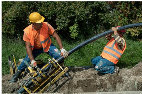
Προϋπολογισμός 32,2 εκ. €, Ενίσχυση WBIF 2,6 εκ. €, αναμενόμενη ολοκλήρωση 2025

Βελτίωση και αποκατάσταση του συστήματος υδροδότησης στο Σεράγεβο. Περιορισμός των διαρροών δια της αντικατάστασης και επισκευής σωληνώσεων, αντλιών και συνδέσεων με νοικοκυριά. Εκτιμώμενο κόστος επένδυσης 32,2 εκ.€ (επιχορήγηση 2,6 εκ.€ από WBIF, επιχορήγηση 0,8 εκ. € από Ε.Ε και συμμετοχή χώρας 0,1 εκ.€). Εκτιμώμενος χρόνος ολοκλήρωσης 2026.