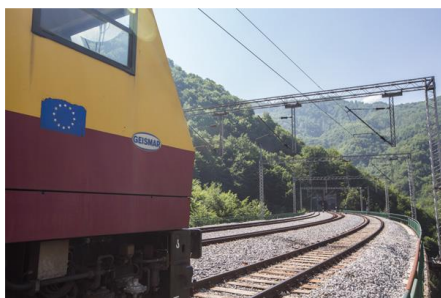
Προϋπολογισμός 226,5 εκ. €, Ενίσχυση Ε.Ε. WBIF 116,5 εκ. €, αναμενόμενη ολοκλήρωση 2029

2. Σιδηροδρομική διασύνδεση Bar (Λιμένας Μαυροβούνιου στην Αδριατική) – Βελιγραδίου, εκσυγχρονισμός και αναβάθμιση του τμήματος Bar – Golubovci, το οποίο αποτελεί επέκταση του αναθεωρημένου Διευρωπαϊκού Δικτύου Μεταφορών - TEN-T (Μαυροβούνιο)