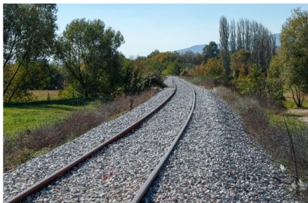
Προϋπολογισμός 120,5 εκ. €, Ενίσχυση Ε.Ε. WBIF 62,6 εκ. €, αναμενόμενη ολοκλήρωση 2028

1. Άξονας VIII (Ανατολική Σιδηροδρομική Παραεγνατία), Τμήμα Σιδηροδρόμου Durrës (Δυρράχιο) – Rrogozhinë, μήκους 33,5 χλμ.. Το έργο αφορά την ανάταξη της γραμμής, ηλεκτροδότηση, σηματοδότηση και εγκατάσταση τηλεπικοινωνίας. Περιλαμβάνεται η επέκταση της γραμμής από Shkozëzët έως Rrogozhinë, η κατασκευή νέων γεφυρών σύμφωνα με τα ευρωπαϊκά πρότυπα, η κατασκευή 4 νέων σταθμών και η ανακατασκευή του σταθμού Shkozëzët (Αλβανία). Έχει εγκριθεί η επένδυση από WBIF, ωστόσο η Ευρωπαϊκή Τράπεζα Επενδύσεων δεν έχει ακόμα υπογράψει ενώ εκκρεμεί και η δημοσίευση της προκήρυξης.