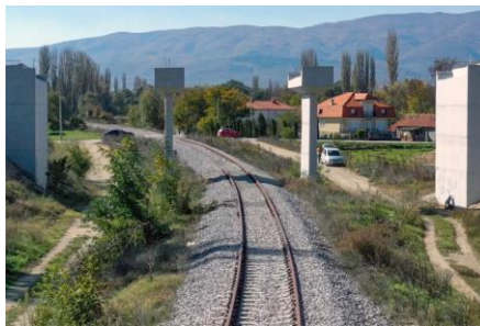
Προϋπολογισμός 36,7 εκ. €, Ενίσχυση Ε.Ε. WBIF 14 εκ. €, αναμενόμενη ολοκλήρωση 2024

3. Οδικός Άξονας VIII, Αυτοκινητόδρομος A2, Τμήμα Kriva Palanka-Stracin μήκους 23 χλμ. (Βόρεια Μακεδονία)