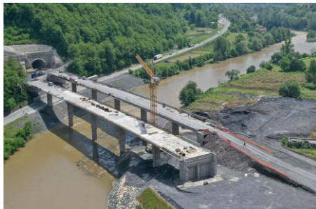
Προϋπολογισμός 383 εκ. €, Ενίσχυση Ε.Ε. WBIF 155,9 εκ. €, αναμενόμενη ολοκλήρωση 2026

2. Οδικός Άξονας Vc, Τμήμα Αυτοκινητοδρόμου Mostar North–Mostar South μήκους 14,2 χλμ. (Βοσνία και Ερζεγοβίνη),