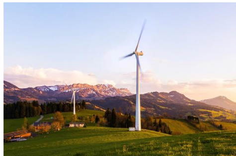
Προϋπολογισμός 90,9 εκ. €, Ενίσχυση Ε.Ε. WBIF 20,9 εκ. €, αναμενόμενη ολοκλήρωση 2028

5. Δημιουργία Αιολικού Πάρκου, εγκατεστημένης ισχύος 50 MW, σε οροπέδιο περιοχής Vlačić. Προβλέπεται να παράγει 112 GWh ηλεκτρικής ενέργειας και να μειώνει τις εκπομπές CO 2 κατά 140.000 τόνους ετησίως (Βοσνία & Ερζεγοβίνη)