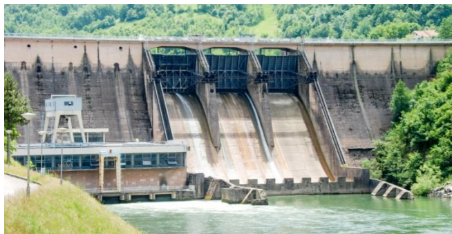
Προϋπολογισμός 40,9 εκ. €, Ενίσχυση Ε.Ε. WBIF 7,7 εκ. €, αναμενόμενη ολοκλήρωση 2028

4. Εκσυγχρονισμός της Υδροηλεκτρικής Μονάδας Bistrica (Σερβία), προς βελτίωση της ενεργειακής αποδοτικότητας και την μείωση των εκπομπών φαινομένου θερμοκηπίου (GHGs)