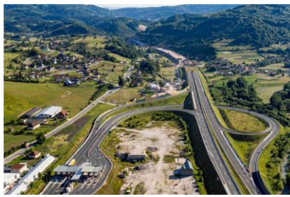
Προϋπολογισμός 354,3 εκ. €, Ενίσχυση Ε.Ε. WBIF 141,4 εκ. €, αναμενόμενη ολοκλήρωση 2026

2. Οδικός Άξονας Vc, Τμήμα Αυτοκινητοδρόμου Mostar North–Mostar South μήκους 14,2 χλμ. (Βοσνία και Ερζεγοβίνη),