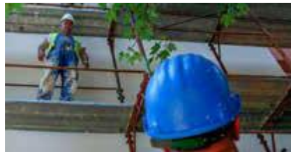
Προϋπολογισμός 231 εκ. €, Ενίσχυση Ε.Ε. WBIF 24 εκ. €

11. Χρηματοδότηση μέτρων βιώσιμης ανάπτυξης και ενεργειακής αποτελεσματικότητας, μέσω του Ταμείου Green for Growth Fund (GGF), με στόχο την μείωση της κατανάλωσης ενέργειας και τον περιορισμό των εκπομπών (Greenhouse Gas Emissions – GHGs) που προκαλούν το φαινόμενο του θερμοκηπίου (Χώρες WB6)