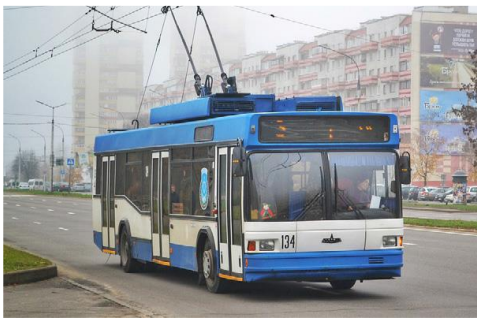
Προϋπολογισμός 111,3 εκ. €, Ενίσχυση Ε.Ε. WBIF 32,1 εκ. €, αναμενόμενη ολοκλήρωση 2029