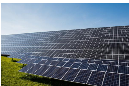
Προϋπολογισμός 41,8 εκ. €, Ενίσχυση Ε.Ε. WBIF 9,6 εκ. €, αναμενόμενη ολοκλήρωση 2026

3. Δημιουργία Φωτοβολταϊκού Πάρκου, ισχύος 50 MW, σε περιοχή Belshë Αλβανίας. Προβλέπεται να παράγει 79 GWh ηλεκτρικής ενέργειας και να μειώνει τις εκπομπές CO 2 κατά 50.000 τόνους ετησίως. Βρίσκεται κοντά στο Belshë στην κεντρική Αλβανία, στην επαρχία Elbasan. Το έργο εκτιμάται σε 41,8 εκ. € εκ των οποίων τα 9,6 εκ.€ είναι επιχορήγηση από το WBIF. Η ΕΤΑΑ έχει εγκρίνει δάνειο ύψους 30 εκ. € ενώ η δικαιούχος KESH πρέπει να συνεισφέρει μόνο 2,2 εκ.€