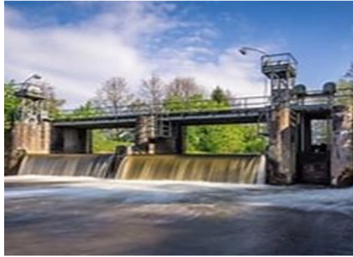
Προϋπολογισμός 77,7 εκ.€ Ενίσχυση Ε.Ε μέσω WBIF 16εκ.€ Αναμενόμενη ολοκλήρωση 2029

5. Εκσυγχρονισμός της Υδροηλεκτρικής Μονάδας Čarlijina (Βοσνία και Ερζεγοβίνη), προκειμένου να επεκταθεί η διάρκεια παραγωγικής ζωής της κατά 15 έτη