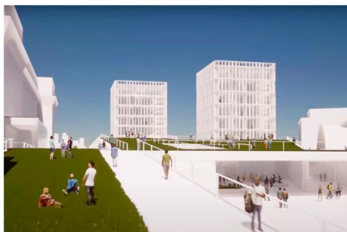
Προϋπολογισμός 36,7 εκ. €, Ενίσχυση Ε.Ε. WBIF 14 εκ. €, αναμενόμενη ολοκλήρωση 2024