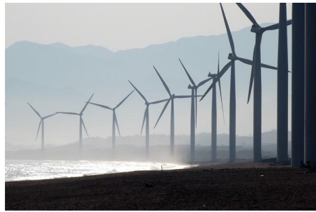
Προϋπολογισμός 200,3 εκ. €, Ενίσχυση Ε.Ε. WBIF 43,7 εκ. €, αναμενόμενη ολοκλήρωση 2027

4. Δημιουργία Αιολικού Πάρκου, εγκατεστημένης ισχύος 132 MW, σε περιοχή Poklečani Δυτικής Βοσνίας & Ερζεγοβίνης. Προβλέπεται να παράγει 436 GWh ηλεκτρικής ενέργειας και να μειώνει τις εκπομπές CO 2 κατά 446.900 τόνους ετησίως (Βοσνία & Ερζεγοβίνη)