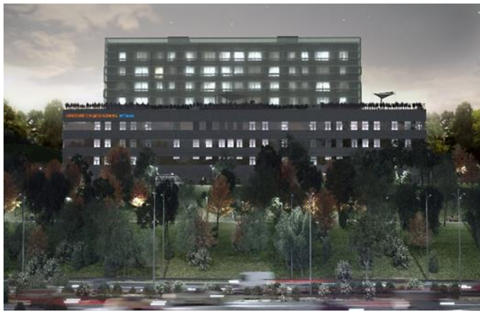
Αναμενόμενη ολοκλήρωση 2026