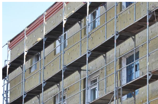
Προϋπολογισμός 27,5 εκ. €, Ενίσχυση Ε.Ε. WBIF 2,2 εκ. €, αναμενόμενη ολοκλήρωση 2025

6. Βελτίωση της ενεργειακής αποτελεσματικότητας κτιρίων (Βόρεια Μακεδονία)